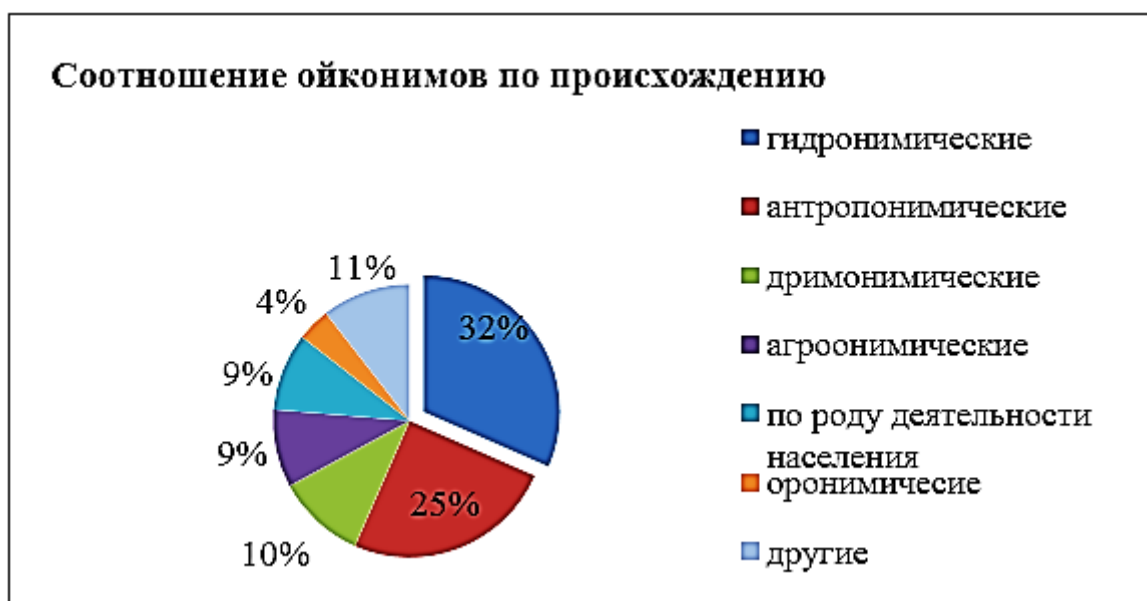
Рис. 2. Диаграмма соотношения ойконимов Звениговского района РМЭ по происхождению (в %)

Роль топонимики в изучении географии довольно значительна. Благодаря топонимам можно судить о древнем облике нынешних территорий и мн. др. Использование топонимов является одним из путей передачи культуры древних людей современным школьникам, так как в них содержатся древнейшие элементы языка; по географическим названиям можно составить картосхемы бывших населенных пунктов (рис. 3). По работе О.А. Федоровой (2006 г.) [4].