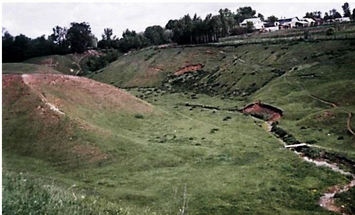
Рис 1. Фото. р. Арявблиз д. Избеби Урмарского района Чувашской Республики

Студенты сопоставляют топонимы через фотографии (рис. 1). Чув. сл. «ара», «авар» – широкое место, где скопилась вода / Н.И. Ашмарин. Словарь чувашского языка. 1993/. Длина реки 37,4 км, по территории Урмарского района протекает длиной 24 км; ширина долины 25–40 шагов, местами 120; уровень воды в разные годы колеблется в пределах 1 метра.