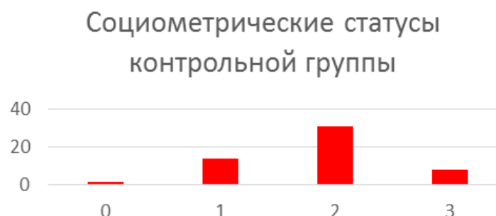
Рис. 2. Социометрия. Социометрические статусы групп