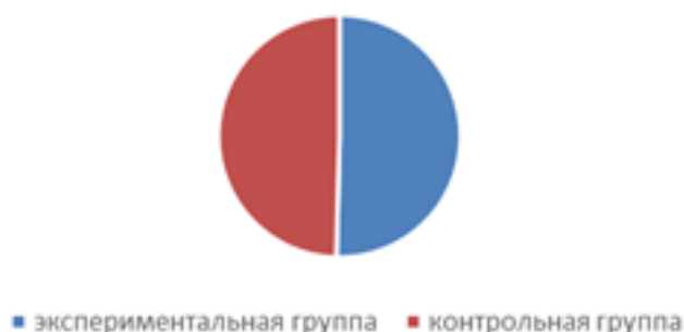
Рис.1. Социограмма групповой сплоченности коллективов

При сравнительном анализе по Т-критерию Стьюдента (при p < 0,05 ) статистически достоверные различия не были выявлены.