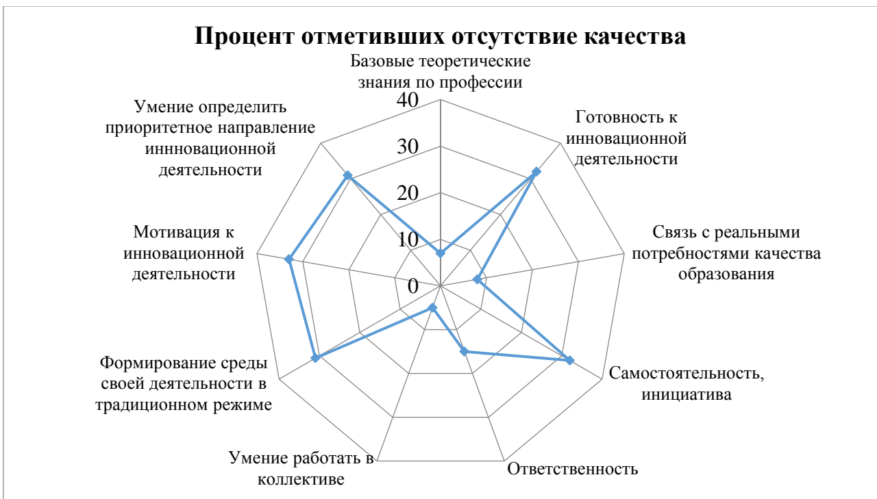
Рис. 2. Обобщенный «портрет педагогов» Гродненской области (по мнению работодателей)

При этом оценка качества образовательной среды, проведенная методом опроса, установила, что педагоги позитивно оценивают уровень качества образовательного пространства, в котором они работают: большинство из 9 показателей близки к максимальному значению – 5 баллов, и нет показателей, меньших 3 (рис. 3).