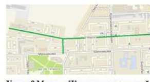
Улица 8 Марта в Железнодорожном районе