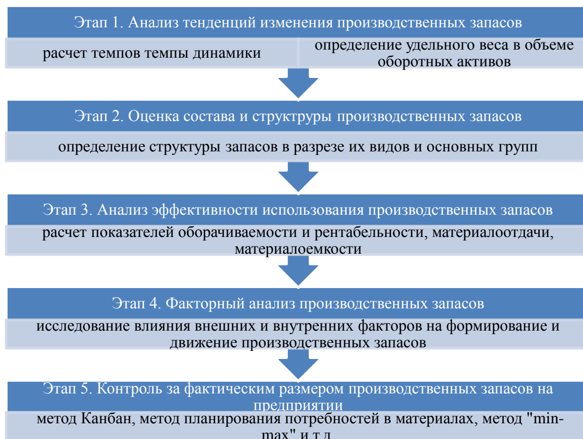
Рис. 2. Этапы политики управления производственными запасами

На втором этапе анализируется состав и структура производственных запасов путем сравнения базовых и отчетных периодов. Анализ структуры показывает удельный вес видов запасов в их общей стоимости, а также их долю в составе оборотных активов. При изучении структуры активов используются горизонтальный и вертикальный анализы.