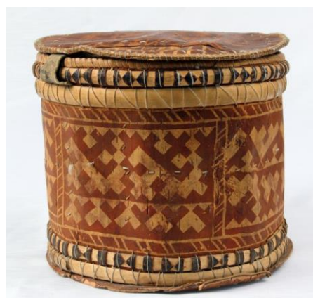
Рис. 2. Коробка берестяная. Музей Природы и Человека, г. Ханты-Мансийск