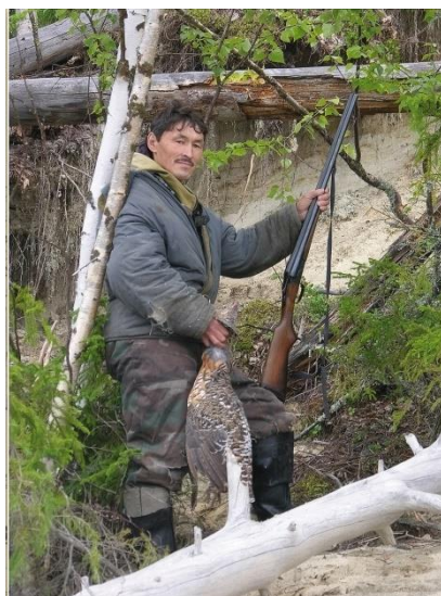
Рис. 6. Мужчина-ханты на охоте.