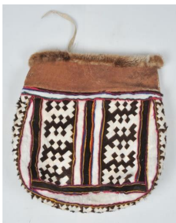
Рис. 3. Сумка меховая орнаментированная – Тучан. Этнокультурный центр, г. Белоярский