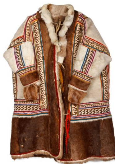
Рис. 4. Женская меховая шуба – ягушка. Этнокультурный центр, г. Белоярский