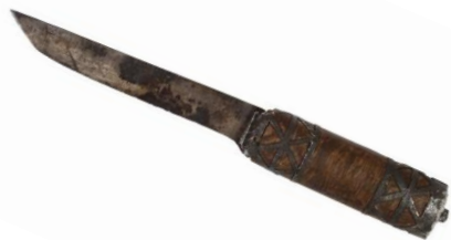
Рис. 5. Снаряжение охотника. Нож. Музей Природы и Человека, г. Ханты-Мансийск