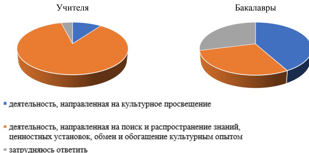
Рис. 1. Результаты опроса учителей начальных классов и бакалавров 4 курса направления подготовки «Начальное образование»

Анализ показал, что некоторые респонденты ни стали долго думать и просто переформулировали вопрос в ответ (2% учителей и 42% бакалавров). Большинство учителей (86%) и некоторые студенты (29%) попытались дать ответ более ответ общими фразами и словами.