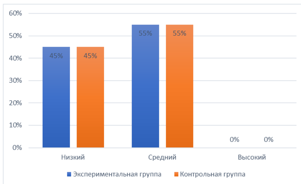
Рис. 1. Сравнение количественных результатов исследования контрольной и экспериментальной группы по всем диагностическим методикам на констатирующем этапе исследования

Представим полученные результаты на рисунке 1.