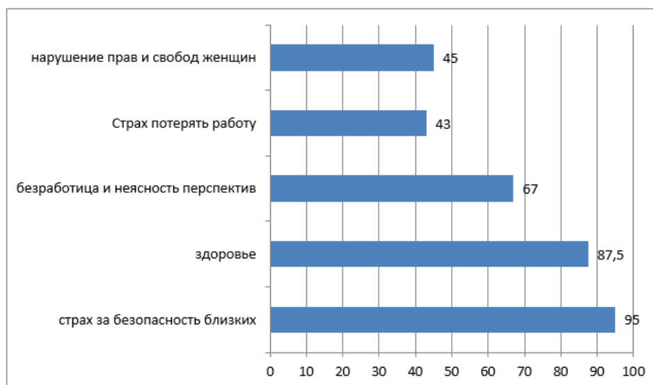
Рис. 2. Иерархия значимости угроз социальной безопасности

Мы попросили респондентов указать, какие проблемы и угрозы они считают наиболее актуальными. В результате выяснилось, что для женщин наиболее значимы такие грозы, как «страх за безопасность близких (95,0%), здоровье (87,5%), безработица и неясность перспектив (67,0%), нарушение прав и свобод женщин (45,0%), страх потерять работу (43,0%) (рис. 2).