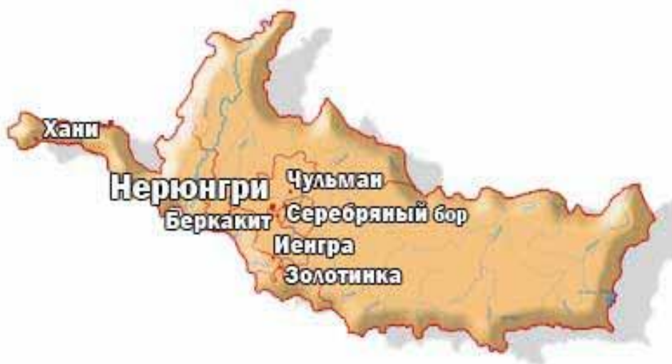
Рис. 1. Населенные пункты Нерюнгринского района

Административный центр района – город Нерюнгри. В состав района входит 6 городских поселений: «Город Нерюнгри», «Поселок Чульман», «Поселок Беркакит», «Поселок Серебряный Бор», «Поселок Золотинка», «Поселок Хани» и одно сельское поселение – «Село Иенгра». Население района, по данным на 01 января 2017 года составляет 74, 986 тыс. чел., в том числе городское – 73,752 тыс. чел., сельское – 1,234 тыс. чел. Плотность населения составляет – 0,8 чел. на кв. км.