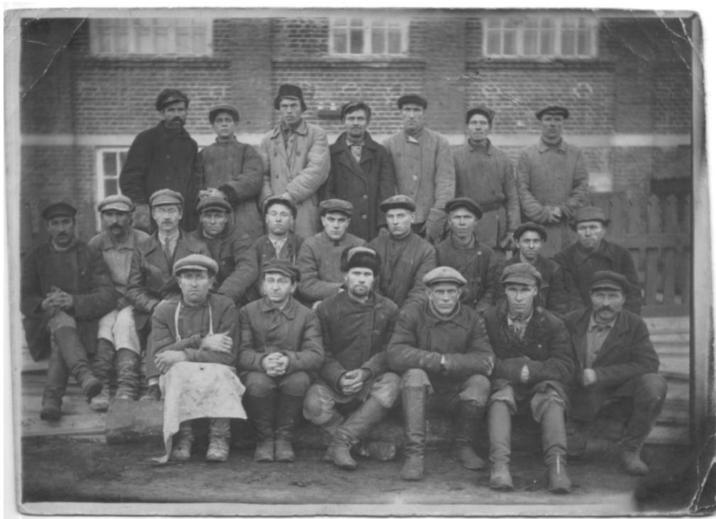
Рис. 2. Рабочие на фоне завода «Большевик».

Свой строительный талант он не раз проявлял и в мирное, и в военное время. Его трудовой вклад при воздвижении Сурского рубежа получил заслуженное признание.