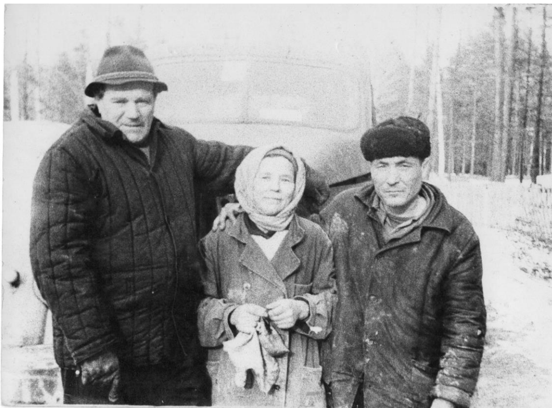
Рис. 5. Фото из семейного архива. На обратной стороне надпись: Стр-во жил дома на торфе («торфом» называется п. Лесной на окраине г. Шумерля – авт.). Конец марта 1975 г.