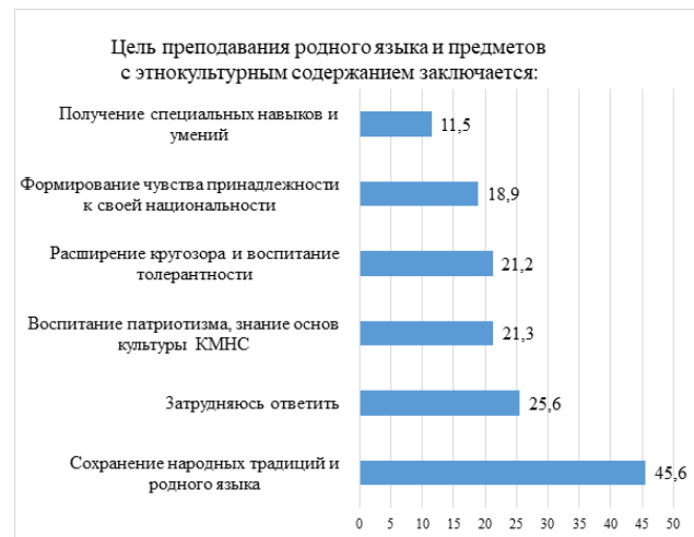
Рис. 1. Ответы на вопрос: «В чем, по Вашему мнению, заключается цель преподавания родного языка и других предметов с этнокультурным содержанием?», в процентах