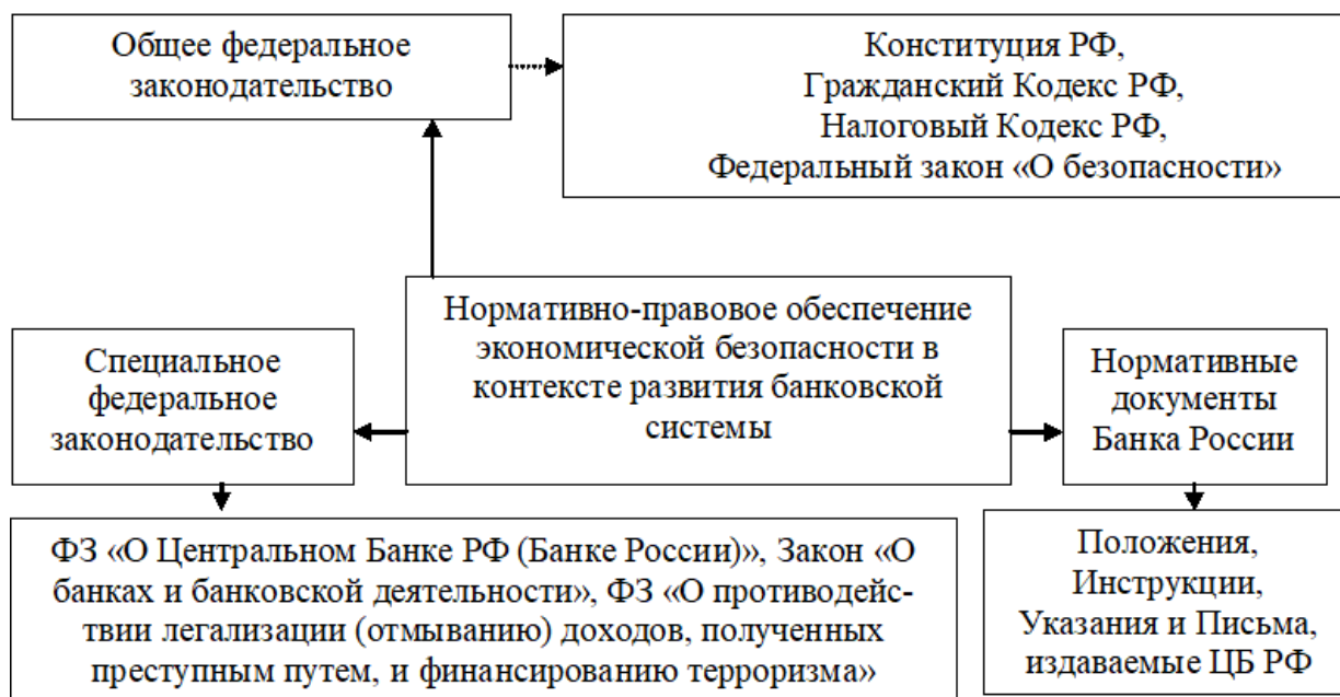
Рис. 1. Нормативно-правовое обеспечение экономической безопасности в контексте развития банковской системы [4]

В современных реалиях система нормативно-правового регулирования банковской системы РФ включает в себя следующие нормативные блоки (рис. 1).