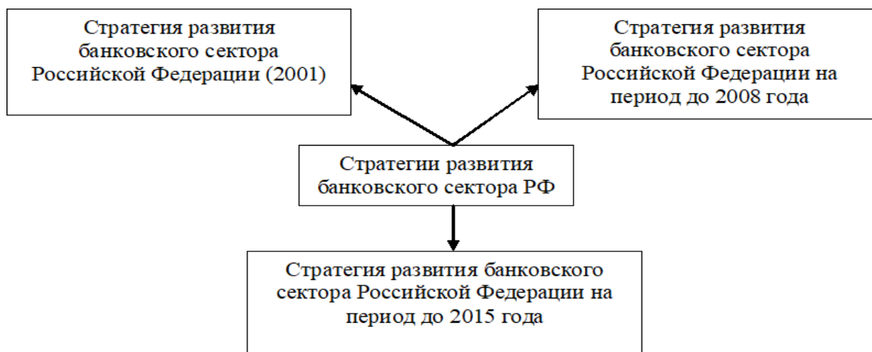
Рис. 2. Стратегии развития банковского сектора РФ [1–3]

Основным документом стратегического развития банковской системы РФ являлась «Стратегия развития банковского сектора РФ», где обозначены целевые ориентиры, направления и планируемые мероприятия по обеспечению деятельности и эффективности банковской системы России (рис. 2).