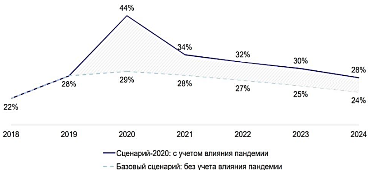
Рис. 2. Изменение прогноза e-commerce под влиянием пандемии covid-19, % [3]

заставляя фирмы конкурировать в вопросах ценообразования). Государство получает возможность частично сократить расходы на документооборот и упростить его, что положительным образом сказывается на имидже, а также получить дополнительные доходы в бюджет в виде налогов.