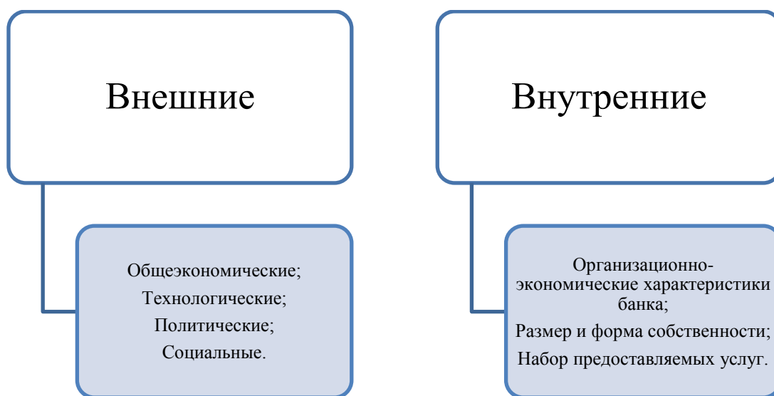
Рис. 4. Факторы, непосредственно влияющие на эффективность и качество банковского сектора Краснодарского края

К внутренним относятся факторы, которые контролируются руководством того или иного регионального банка. При этом, именно внутренние факторы отражают имеющиеся различия во внутренней политике банка и направленности его деятельности.