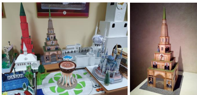
Рис. 2. Проект «Достопримечательности нашего города»