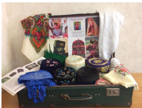
Рис. 1. Проект «Музей в чемодане»