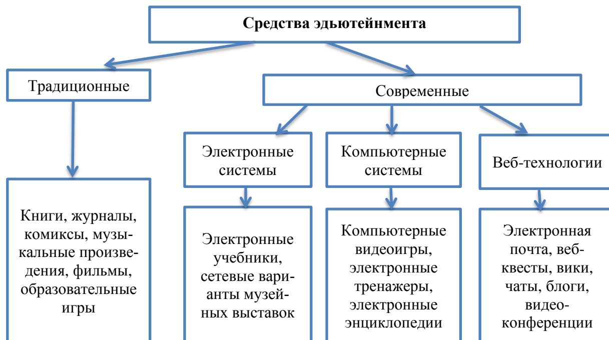
Рис. 1. Классификация средств эдьютейнмента

В технологии эдьютейнмента могут сочетаться теория и реальная практика, дискуссионный клуб, игровая территория, лаборатория экспериментов, квесты, воркшопы, перформансы и многое другое, что сегодня популярно в различных областях человеческой деятельности.