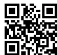
Рис. 3. QR-коды с шифрами к заданиям

Отличия упражнений данной методики проявляются в обучении с акцентом на увлечение, эмоциональной окрашенности процесса обучения, высокой мотивации учиться; чередовании средств и приемов, соблюдении совокупности педагогических технологий.