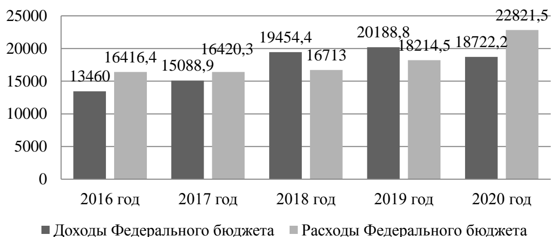
Рис. 1. Динамика доходов и расходов федерального бюджета, млрд руб.

Анализ структуры и динамики доходов федерального бюджета за 2016–2020 годы показывает, что уровень доходов возрос по сравнению с началом периода, тем не менее, в 2020 году он снизился на 1466,6 млрд. рублей по сравнению с 2019 годом. Причиной этому послужила мировая пандемия. В структуре доходов наибольший удельный вес занимают не нефтегазовые доходы, на конец анализируемого периода они составили 72% и увеличились на 8% по сравнению с 2016 годом. Кроме того, наблюдается рост доходов, связанных с внутренним производством, к концу 2020 года они выросли на 5,4% и составили 33,4%. Также мы наблюдаем положительную динамику, связанную с ростом доходов от НДС, в 2020 году они выросли на 3,1% и составили 22,8% от общей суммы доходов (таблица 1).