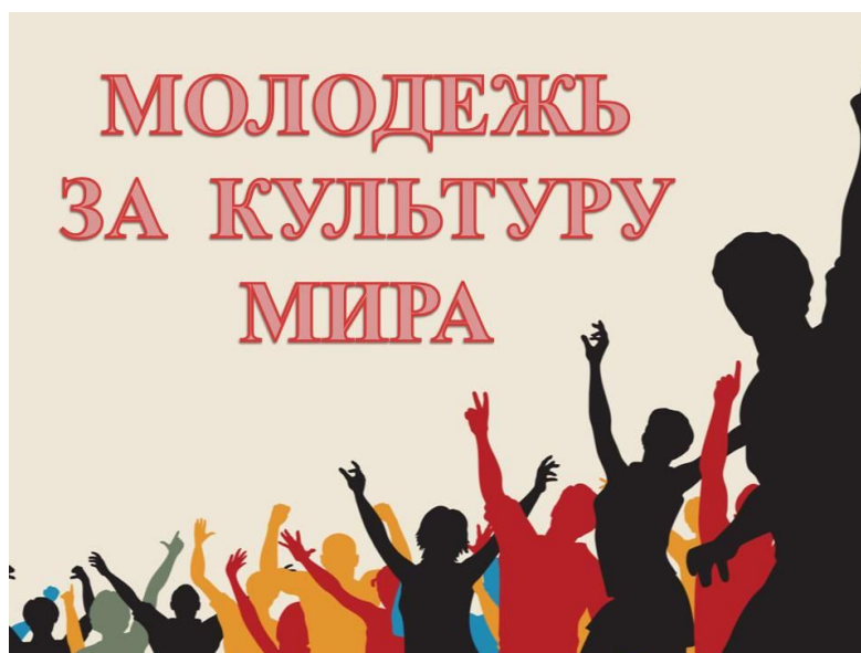
Рис. 2. Развитие молодого поколения – основа развития культуры страны

Правительство включает в развитие культуры разнообразные реформы с целью улучшения положения духовной сферы общества. Демократизация общественных отношений и снятие идеологических ограничений способствовали раскрепощению творческого потенциала во многих областях культуры. Несмотря на падение общего тиража печатных изданий, расширился спектр названий книжной продукции, увеличилось количество телевизионных каналов и радиостанций, появилось множество информационно-аналитических и познавательно-развлекательных передач.