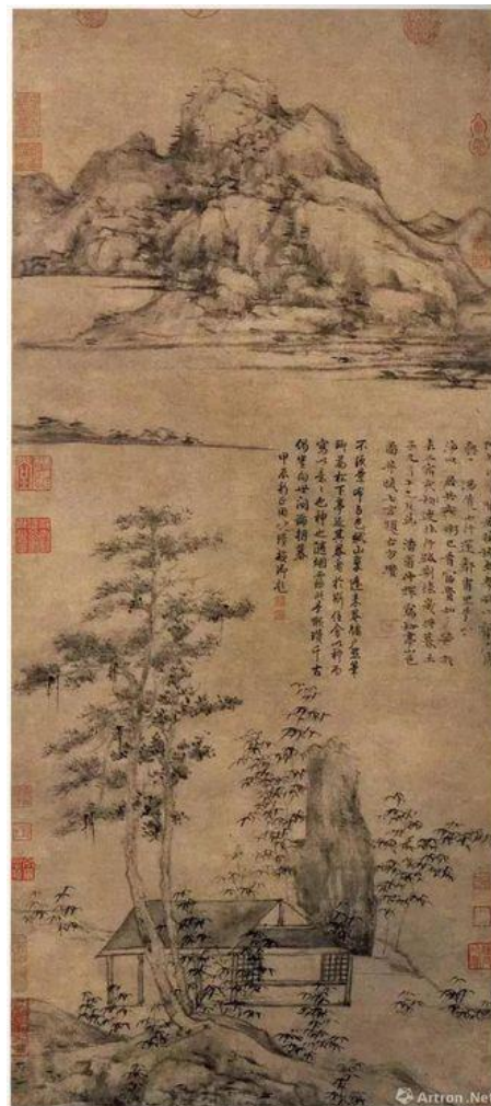
Рис. 5. Ни Цзань, «Горный пейзаж с беседкой под соснами»

Пейзажи Ни Цзань наполнены графичными линиями, они необычайно тонки технически и духовно. В своих картинах он выражал чистоту отчужденности и покой, глубокий смысл одновременно сплетался с простым изложением сюжета.