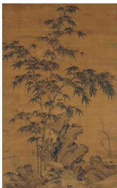
Рис. 1. Ли Кань. «Пара бамбуков с искривлёнными стволами и камни»

а также, очень подробно рассказывает о значении линии и штриха при изображении стебля и листьев, наставляет читателя на технические свойства живописи. Он писал: «При монохромном изображении бамбука выдели четыре части растения: стебель, узлы, ветви и листья» ... «В каждом штрихе должна жить идея, каждое положение должно быть естественным» ... «Если изображаешь только один-два побега, то тушь может быть произвольных оттенков. Если же – три и больше, то передние побеги пиши темной тушью, задние – посветлее, потому что одним тоном уде нельзя передать передний и задний план». «Книга о бамбуке» – самый значительный эстетический труд китайской живописи.