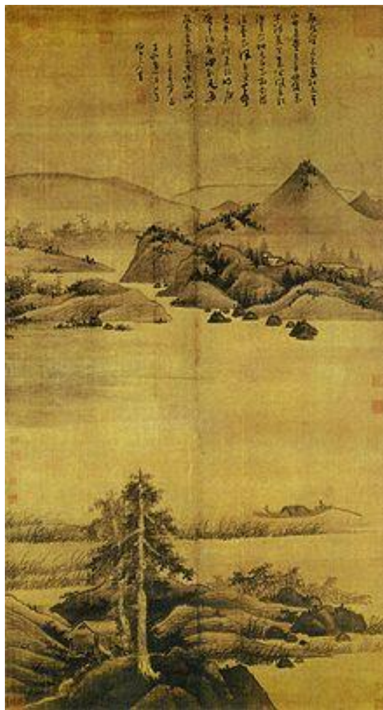
Рис. 6. У Чжэнь. Рыбак. 1342 г.

Эстетический феномен эпохи Юань был выражен в этот период весьма стремительно. Ясность членений, точность слова, изысканность и простота образов природы отличают как сами произведения, так и теорию в период Юань.