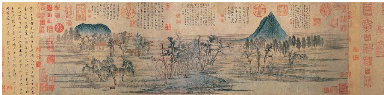
Рис. 4. Чжао Мен-фу. «Осенние цветы в горах Цяо и Ху», фрагмент

Китайский живописец Чжао Мен-фу (1254–1322) – потомок императорской семьи династии Сун, был ключевой фигурой в развитии каллиграфии периода Юань. Считал, что живопись и каллиграфия более чем близки по своему осмыслению. Он писал пейзажи, бамбук, цветы в буквальном смысле слова, чем рисовал. Так же художник Чжао почитал идею древности – «гуи», что сказалося на его стилистике. В своем творчестве старался соединить «гуи» и современность. Мен-фу писал: «Живопись и каллиграфия, по существу, одно и то же: изображать камень – это значит писать в стиле «фэйбай»; изображать дерево – значит писать в стиле «чжуань»; Если вы хотите написать бамбук, это значит использовать все восемь приемов каллиграфии – «юнцзы бафа».