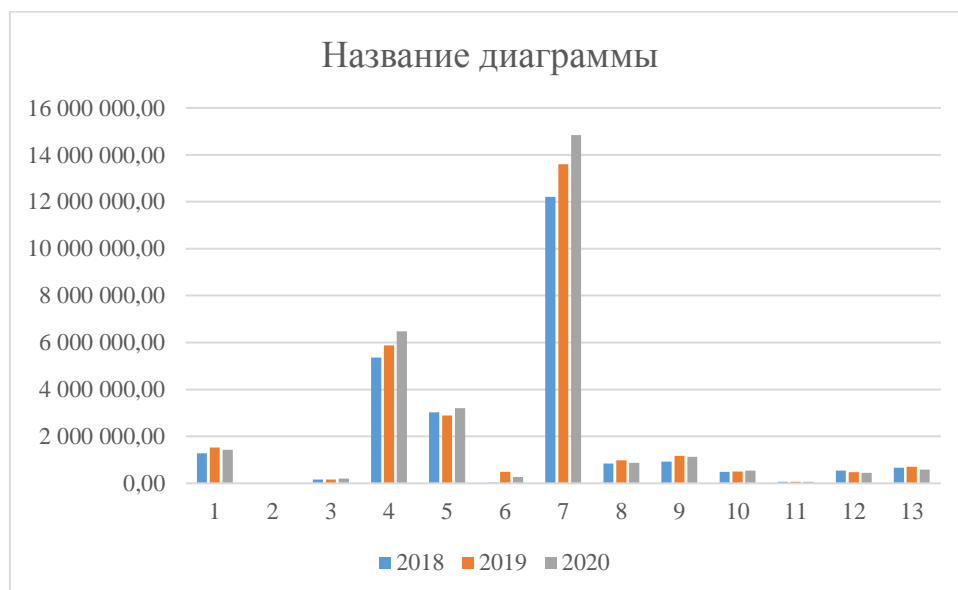
Рис. 2. Изменение расходов бюджета г.о. Самара в 2018–2020 гг.

Важно отметить, что за три года изменения в структуре расходов были минимальные. На диаграмме (рис.2) видно, что расходы заметно возросли в статьях «Национальная экономика» и «Образование». По остальным статьям отмечается несущественные изменения как в сторону роста, так и в сторону снижения расходов. Показатели также пронумерованы в соответствии с их нумерацией в табл.1.