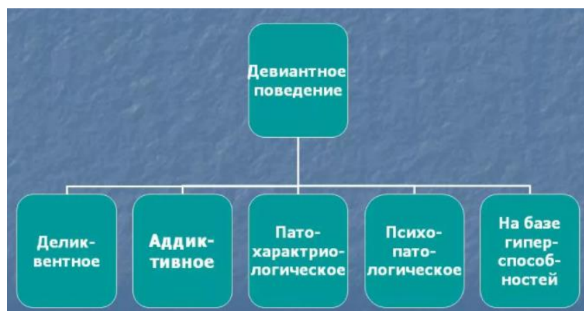
Рис. 1. Типы девиантного поведения

3. Психолого-педагогические причины (к этой группе относятся причины, вызванные недостаточной компетенцией преподавателя, плохой атмосферой вокруг ребенка, вследствие чего он не смог освоить все моральные нормы).