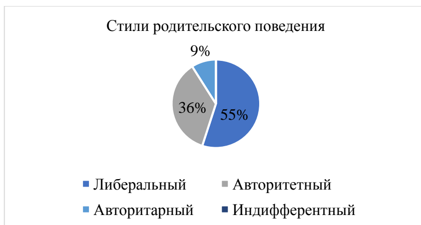
Рис. 1. Результаты диагностики экспериментальной группы по методике С. Степанова «Стили родительского поведения»

Для того, чтобы рассмотреть результаты диагностики более наглядно, визуализируем данные таблицы в круговую диаграмму. Рассмотрим результаты диагностики экспериментальной группы.