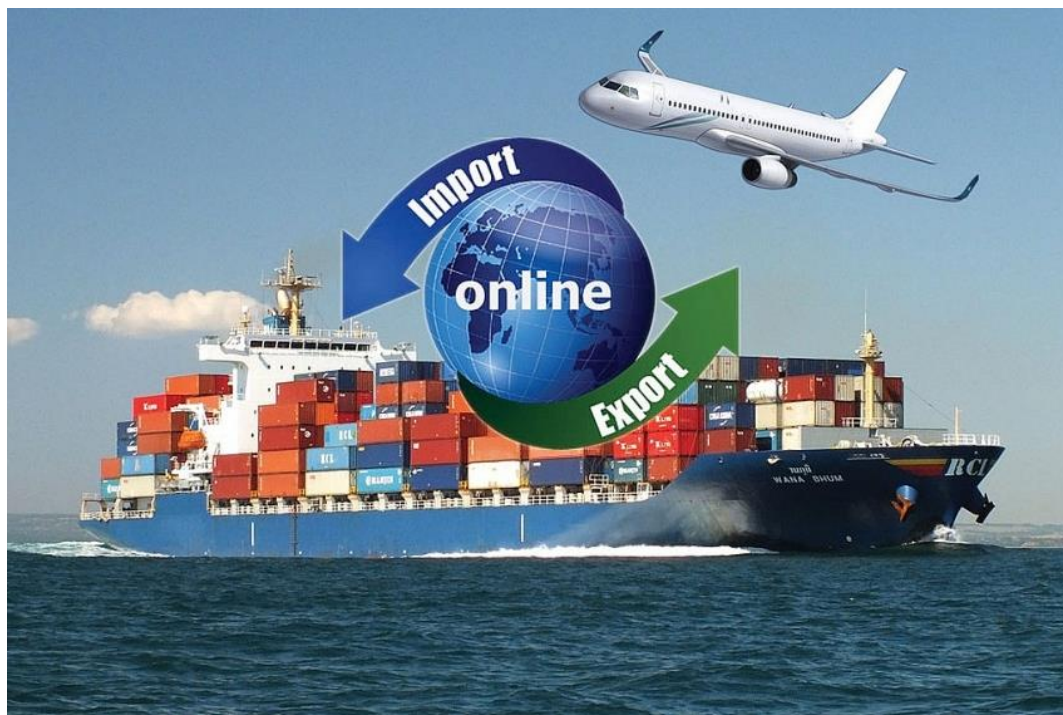
Рис. 1. Экспорт и импорт товаров

Успешному решению проблем международных экономических отношений России должно способствовать развитие механизма государственного стимулирования экспорта и импортозамещающего производства на микро- и макроуровнях; дальнейшее развитие инфраструктуры внешнеэкономической деятельности.