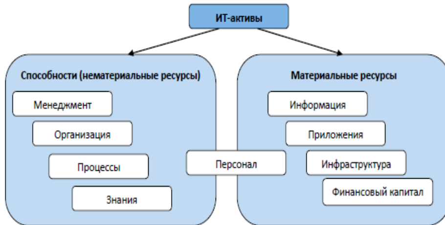
Рис. 1. Состав ресурсов и способностей согласно ITILv3

Из рисунка 1 видно, что персонал как актив с одной стороны представляет собой ресурс (численность персонала), а с другой – способности (умения, навыки, компетенции). Комплекс способностей и ресурсов предназначен для достижения основной деятельности компании.