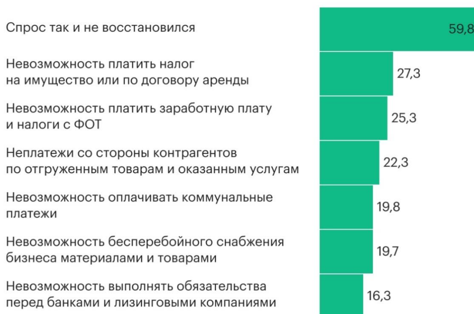
Рис. 2. Главные финансовые проблемы организаций

С начала 2020 года Институтом Полномочного представителя Президента РФ ведется мониторинг «Мнения субъектов малого и среднего предпринимательства о мерах государственной поддержки в период вспышки коронавирусной инфекции». Таким образом, к лету 2020 года Правительство РФ признало заинтересованными 4,17 млн малых предприятий из общего числа хозяйствующих субъектов (около 6,05 млн). В 2021 году российский малый и средний бизнес сталкивается с теми же проблемами, что и на пике пандемии, главные финансовые проблемы рассмотрены на рисунке 2.