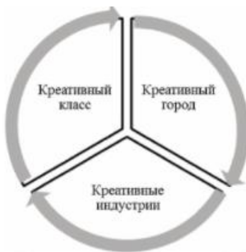
Рис. 1. Составляющие креативной экономики

Изначально обращать внимание на такое понятие, как «креативная индустрия», стали по причине перехода к постиндустриальному развитию, то есть появлению информационных сфер. В современной экономике главную роль играют знания, то есть способности и умения наемной рабочей силы.