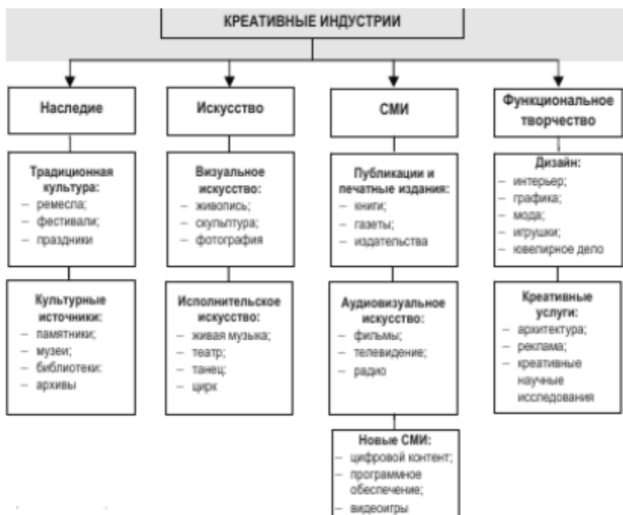
Рис. 2. Модель креативных индустрий по торговле и развитию

Креативные индустрии быстро развиваются. Доля созданных новых товаров и услуг превышает процент изготовления шаблонных товаров.