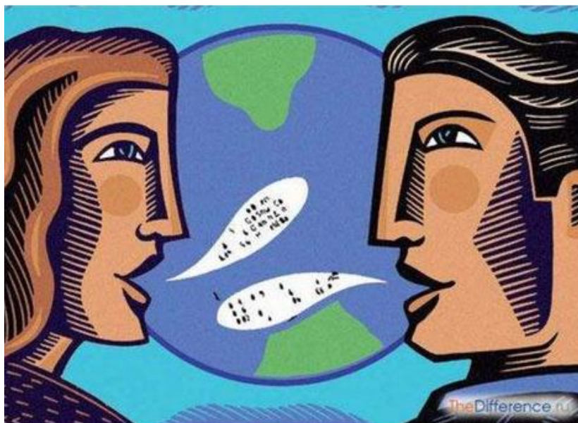
Рис. 1. Язык – система звуковых и письменных символов