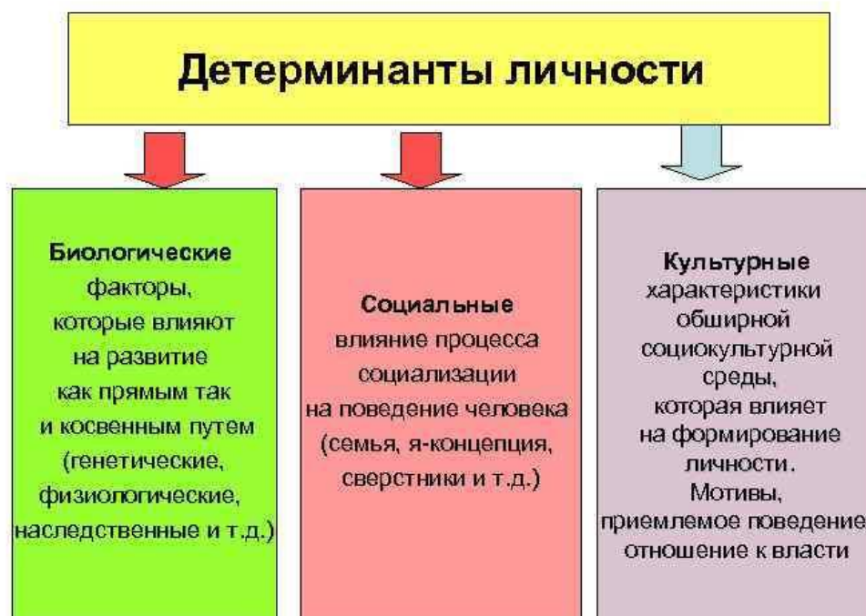
Рис. 1. Составные части детерминантов личности

7) эстетические отношения: эстетика манер, речи и поведения молодого поколения и всех членов семьи.