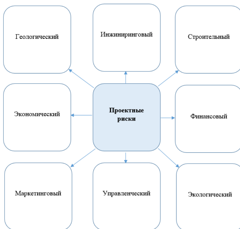
Рис. 2. Виды проектных рисков

Проектный уровень состоит из рисков, связанных непосредственно с осуществлением его деятельности (рисунок 2).