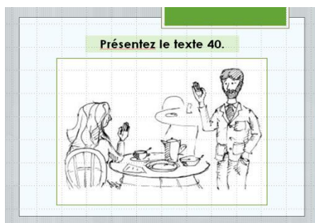
Рис. 2. Контроль домашнего задания

Второй блок. Культурологическая составляющая: на первом слайде размещается картинка, соответствующая страноведческой тематике урока, например, город Париж, Булонский лес, набережная Ниццы и проч. Сама по себе красочная фотография не только имеет целью настроить студентов на тему урока, но и вызывает интерес к тому, что их ждет на занятии, желание найти на карте тот или иной город.