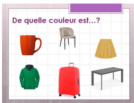
Рис. 8. Тренировочные упражнения

Чтобы презентация в образовательном процессе была понятной и эффективной и достигала целей урока, мы решили следовать некоторым правилам ее оформления. Например, использовали единый стиль (цветовую гамму и шрифт) для всех пятидесяти уроков учебника. Также мы старались избегать загруженности слайда и размещения текста одним большим полотном, разбив его на блоки и вынеся только важную информацию, оставив за скобками детали, которые педагог всегда может объяснить устно. Эти факторы способствуют более легкому восприятию информации, повышая ее эмоциональную привлекательность [2, с. 49].