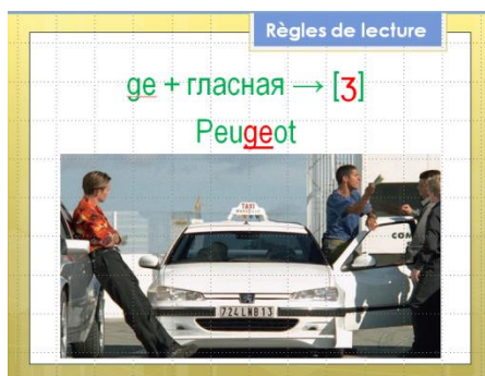
Рис. 4. Введение нового материала по фонетике