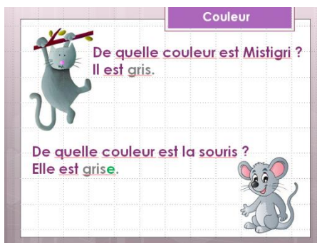
Рис. 5. Введение нового лексического материала