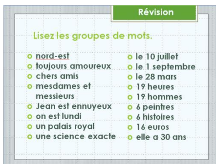
Рис. 1. Проработка фонетики

Первый блок. Контроль пройденного материала (домашнего задания), который осуществляется двумя способами: чтение с экрана слов по изученным на предыдущем уроке правилам и пересказ текста с опорой на картинки.