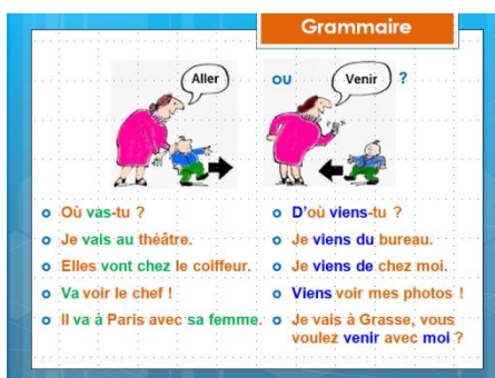
Рис. 6. Введение нового грамматического материала

Четвертый блок. Закрепление нового материала посредством тренировочных подстановочных упражнений с экрана. Они либо дублируют упражнения из учебника, либо созданы специально для грамматико-лексической темы урока.