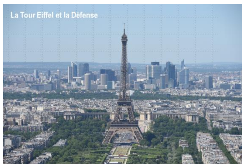
Рис. 3. Культурологическая и страноведческая составляющая

Второй блок. Культурологическая составляющая: на первом слайде размещается картинка, соответствующая страноведческой тематике урока, например, город Париж, Булонский лес, набережная Ниццы и проч. Сама по себе красочная фотография не только имеет целью настроить студентов на тему урока, но и вызывает интерес к тому, что их ждет на занятии, желание найти на карте тот или иной город.