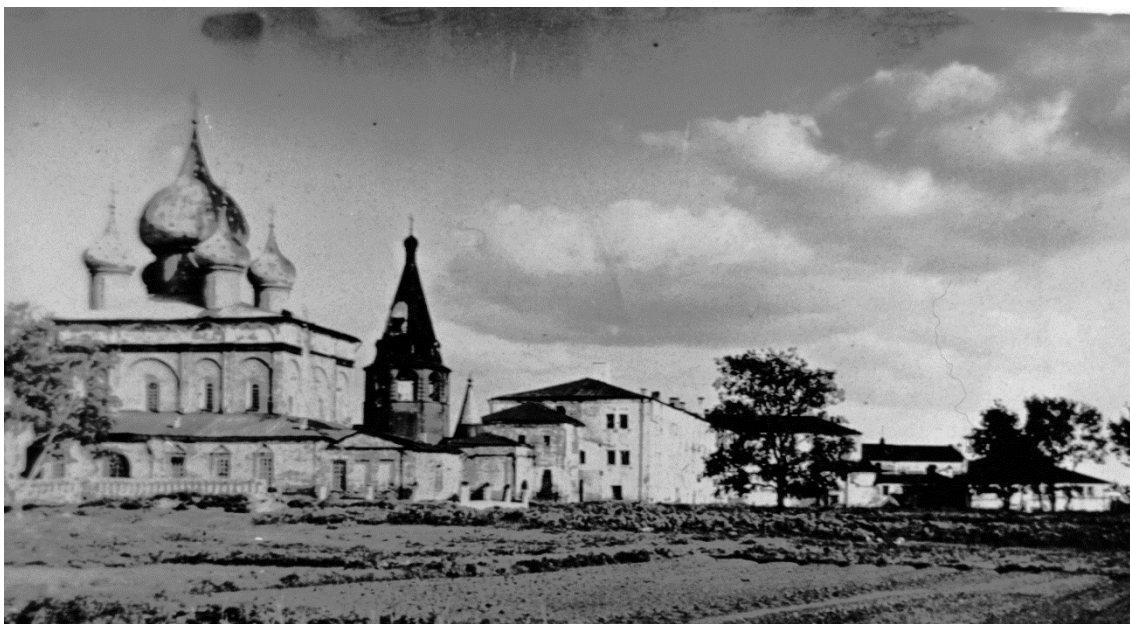
Рис. 3. Собор Рождества Богородицы в Суздале. 1222–1225. Вид с севера до реставрации (вверху). Начало XX века