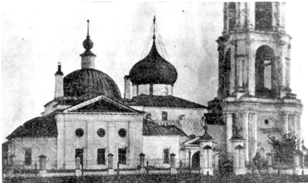
Рис. 1. Георгиевский собор в Юрьев-Польском. 1230–1234.

что стало поводом для создания в храме своеобразного лапидария, составившего уникальную музейную экспозицию.