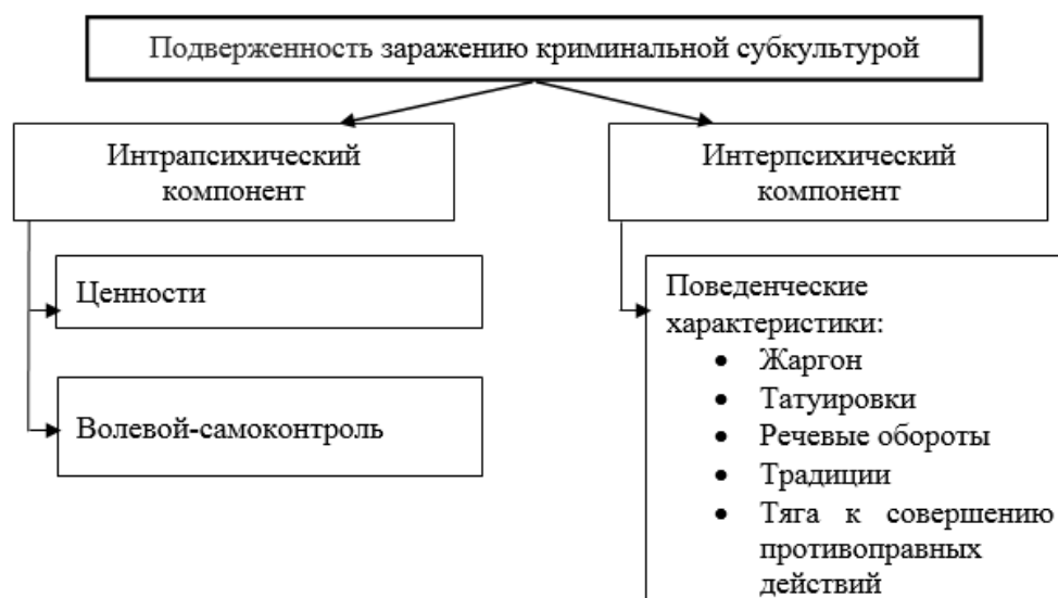
Рис. 1. Структура понятия «подверженность заражению криминальной субкультурой»

Социальный интеллект, согласно концепции, Дж. Гилфорда является системой интеллектуальных способностей, независимых от фактора общего интеллекта и связанных, прежде всего, с познанием поведенческой информации, включая невербальный компонент [2].