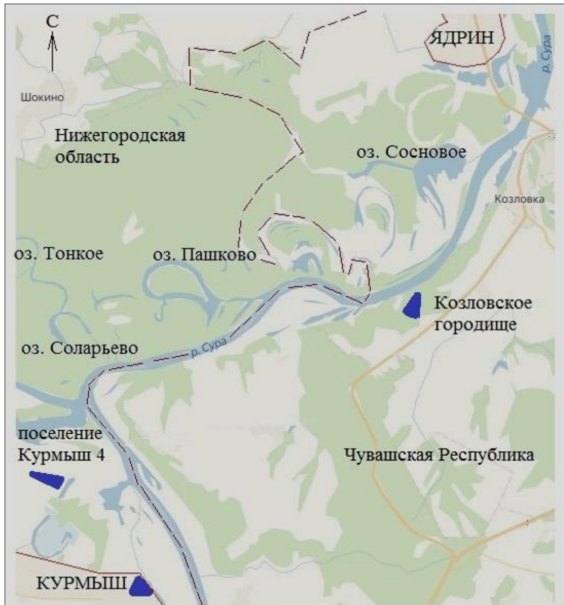
Рис. 2. Локализация археологических памятников и гидронимов, входящих в удел

пойменной части и изменения пойменных озер для такой территории обычное дело (рис. 2).