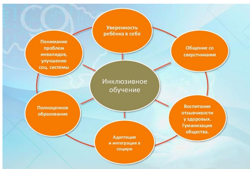
Рис. 2. Достоинства инклюзивного образования

5) праздники, объединяющие всех детей, сближающие их.