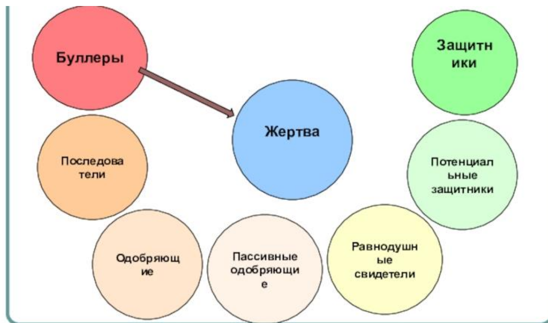
Рис. 2. Роли наблюдателей в ситуации буллинга

Важно, чтобы каждый свидетель такого отрицательного отношения к сверстникам, применял меры по его предотвращению. Так, бездействующие зрители автоматически становятся соучастниками данного правонарушения.