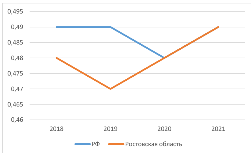
Рис. 2. Занятое население Ростовской области в сравнении с РФ

Количество официально занятого населения Ростовской области составляет 2501901 человек (59.6%), пенсионеров 1217368 человек (29%), а официально оформленных и состоящий на учете безработных 243474 человека (5.8%).