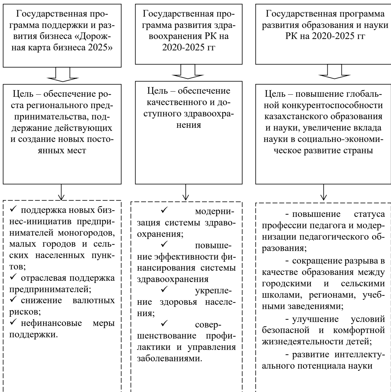
Рис. 2. Основные государственные программы, направленные на повышение уровня жизни, реализуемые в Республике Казахстан

В Казахстане государственные институты играют важную роль в регулировании жизни населения, что подтверждается использованием прямых административных методов управления, включая государственные программы. Характеристика основных государственных программ, направленных на повышение уровня и качества жизни населения Республики Казахстан представлена на рисунке 2 [3].