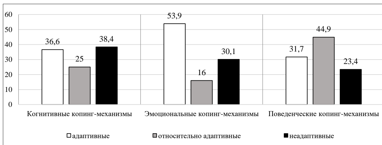
Рис. 1. Копинг-механизмы обучающихся подросткового возраста (данные Теста Э. Хейма, в %)

В ходе исследовательской работы были получены данные, представленные на рисунке 1, позволяющие охарактеризовать особенности копинг-механизмов обучающихся подросткового возраста.