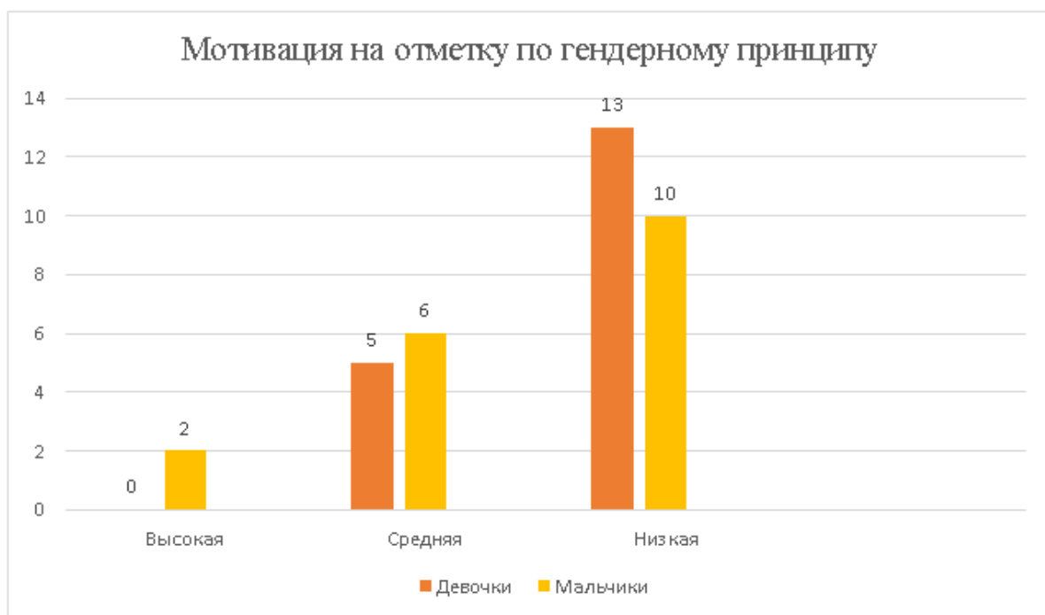
Рис. 2. Гендерные различия в показателях мотивации на приобретение знаний и получение отметки