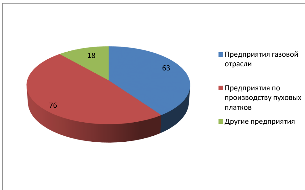
Рис. 2. Заинтересованность респондентов в экскурсиях на предприятиях Оренбургской области

На вопрос об участии в промышленных экскурсиях, 89 человек ответили положительно (да, участвовали), 57 человек из них участвовали в промышленных экскурсиях на Черноморском побережье России (посещение винодельческих хозяйств, экскурсии на винные заводы). 32 человека назвали разные места (как в России, так и за рубежом), такие как предприятие «Сырт» в Оренбургской области, Московская шоколадная фабрика, а также парфюмерные и косметические фабрики, туры в Болгарию и Францию, Германию и Чехию совмещая отдых с традиционным посещением винодельческих хозяйств, гастрономическими экскурсиями и участвующими в проводимых мастер-классах [5] (рис. 3).