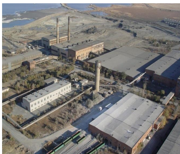
Рис. 5. Гайский ГОК (центральная часть области) (восточная часть области)

Отсюда следует, что одной из наиболее перспективных целевых аудиторий потребителей промышленного и делового туризма являются студенты вузов, средних учебных заведений, школьники для которых, промышленные экскурсии служат как способ обучения, так и средство получения практических знаний и навыков в ходе посещения конференций, симпозиумов и действующих предприятий, При совмещении проводимых практик и экскурсий с учебными занятиями, выпускники учебных заведений будут являться уже профессионально подготовленными и востребованными специалистами на замещение вакантных должностей на определенном предприятии [5,6].