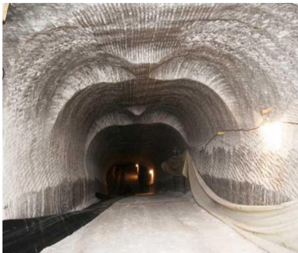
Рис. 4. Соляная шахта в Соль Илецке