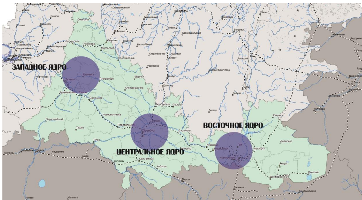
Рис. 1. «Ядра»-центры промышленно-делового туризма на территории Оренбургской области

Анализируя размещение промышленных объектов Оренбургской области и имеющиеся выставочные площадки для проведения форумов, конгрессов, и влияние туризма на социально-экономические условия в регионе, нами были выделены три основных центра - «ядра» промышленно-делового туризма на территории области [5] (рис. 1).