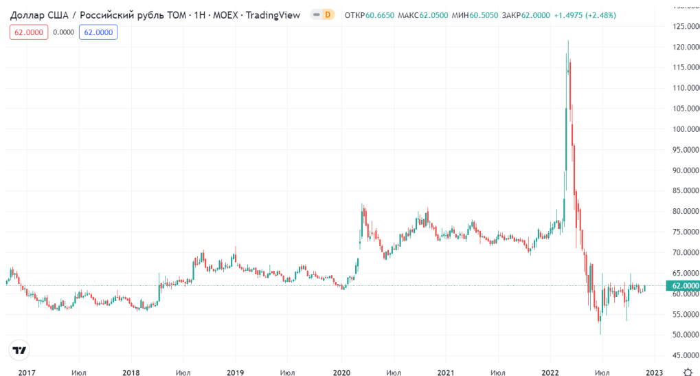
Рис. 2. Технический график валютной пары доллар/рубль (USD/RUB) на рынке Forex [2]

Единственным риском, который существует в данный момент – это нестабильность валютного курса валюты России, которая наблюдается в текущем 2022 году. Обратимся к рисунку 2, где изображен технический анализ динамики валютного курса российского рубля в отношении к американскому доллару.