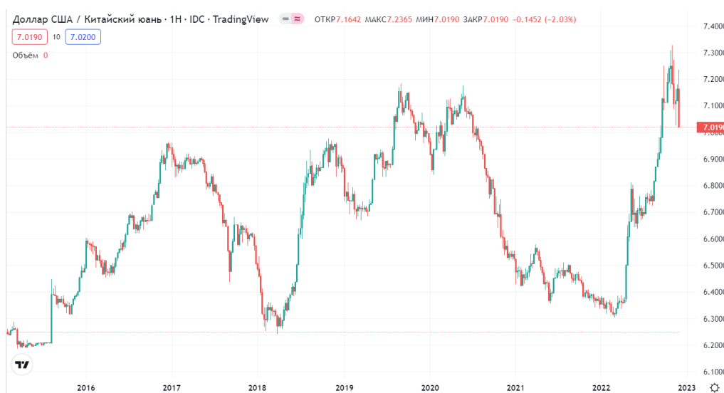
Рис. 3. Технический график валютной пары доллар/юань (USD/CNY) на рынке Forex [3]

3. Девальвация китайского юаня, которая началась, несмотря на попытки НБК удержать устойчивость валютного курса национальной денежной единицы с целью повышения уровня ее инвестиционной и деловой привлекательности (рис. 3).