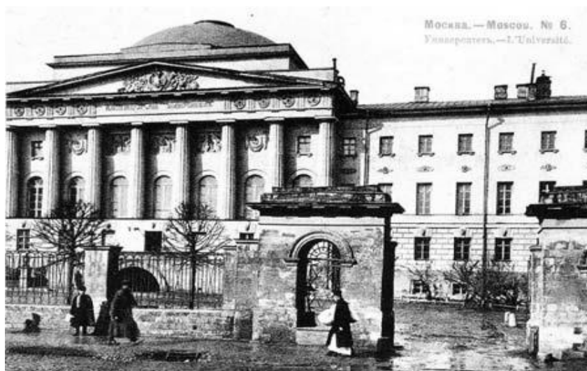
Рис. 2. Здание МГУ на Моховой улице (начало XX века)

Подготовкой съезда занимался особый Комитет съезда преподавателей географии. Этот Комитет включал 35 членов, председателем Комитета съезда учителей географии стал русский географ, антрополог и этнограф, заслуженный проф. МГУ им. М.В. Ломоносова Дмитрий Николаевич Анучин. Комитет провел 8 заседаний, из них 5 заседаний в Политехническом музее и три в здании МГУ на Моховой улице.