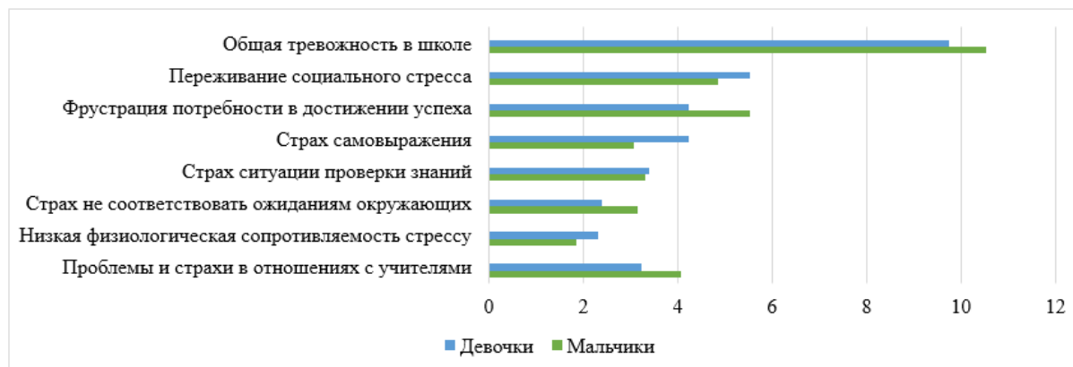
Рис. 2. Соотношение средних значений показателей школьных и учебных страхов у мальчиков и девочек младшего подросткового возраста

Соотношение средних показателей по каждому тревожному синдрому (шкале) у мальчиков и девочек (методика «Тест школьной тревожности Филлипса») представлено на рис. 2.