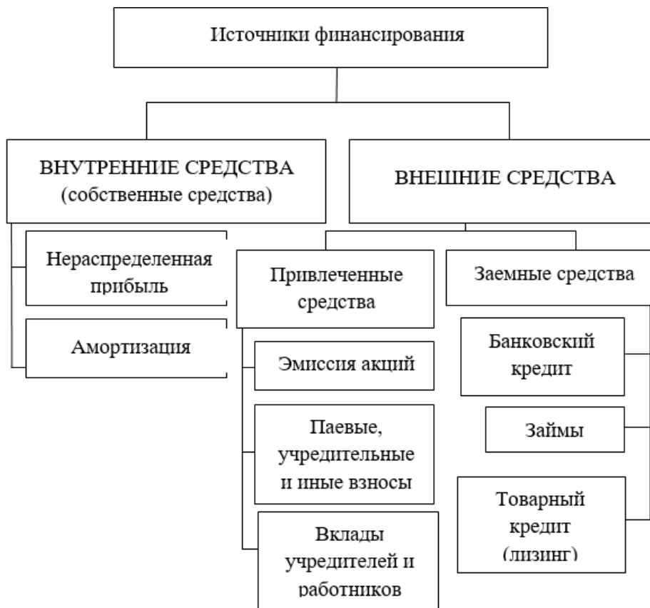
Рис. 1. Структура источников финансирования

Выбор конкретного источника финансирования зависит от специфики деятельности организации и стратегии работы менеджеров. Использование внешних и внутренних источников финансирования имеет свои преимущества и недостатки. Например, к основным достоинствам внутренних источников относят отсутствие ограничений по использованию, минимальные риски потери управления и контроля, к недостаткам – ограниченный объем данных источников финансирования. Внешние источники финансирования могут быть значительными по размеру привлечения, при их использовании задействуются инструменты независимого контроля, однако их применение требует обычно длительной процедуры оформления, покрытия транзакционных издержек, создает риск потери ликвидности и финансовой устойчивости организации.