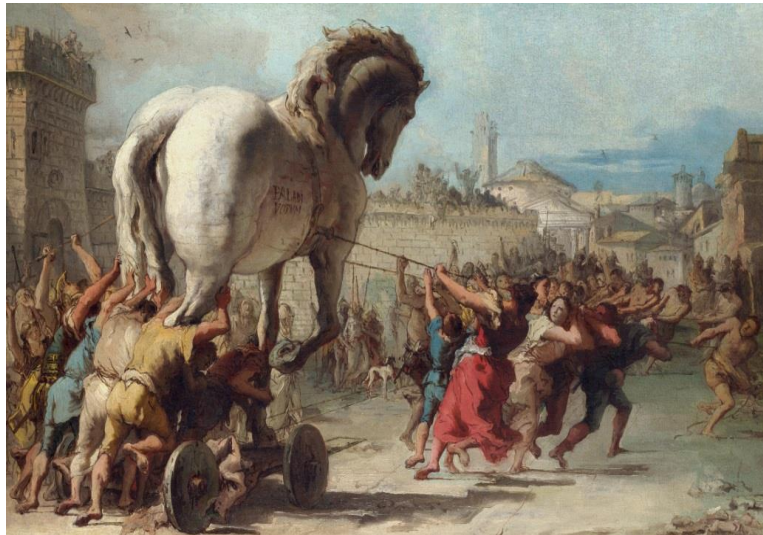
Рис. 4 Тьеполо Джованни Доменико. Троянский конь (ок. 1770).

стен. Чего троянцы не знали, так это последнего плана Одиссея. Он предложил оставить позади огромного деревянного коня с надписью, относящейся к девяти годам, проведенным ими в осаде Трои. Лошадь была подношением богине Афине с просьбой об их благополучном возвращении домой (рис. 4).