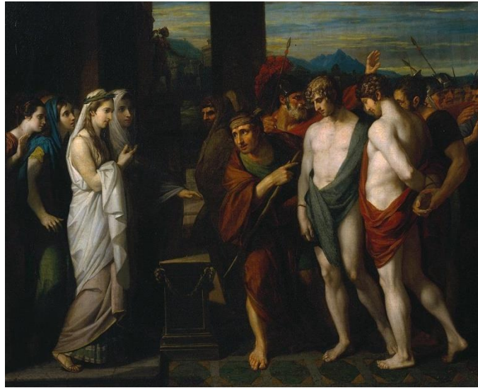
Рис. 9 Уэст Бенджамин (1738 – 1820). Ореста и Пилада ведут к жертвенному алтарю перед Ифигенией. 1766 г.