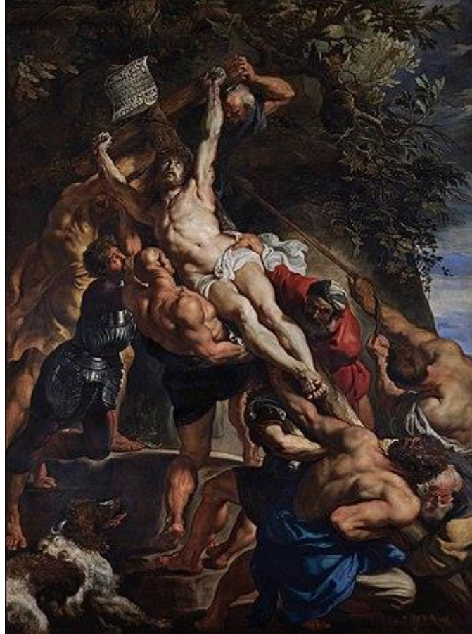
Рис. 2 Рубенс П.П. Воздвижении Креста. 1610–11гг. Собор Антверпенской Богоматери, Антверпен. Бельгия

создал в 1610 году после возвращения в Антверпен для кафедрального собора, просматривается выражение лиц и тел из группы Лаокоона (рис. 2).