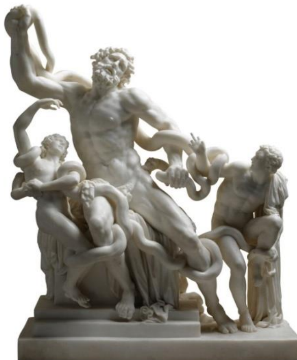
Рис. 1. Агесандр, Полидор и Афинодор Родоский. Лаокоон и его сыновья Вт. пол. I в. до н.э. Мрамор. Музей Пио-Клементино, Ватикан

Многие фрагменты из поэмы Гомера нашли отражение в искусстве разных периодов и народов. Но одна из излюбленных тем творцов, работающих в разных видах искусства, – это трагедия Лаокоона и его сыновей. Познакомимся сначала со скульптурным наследием античной культуры (рис. 1).