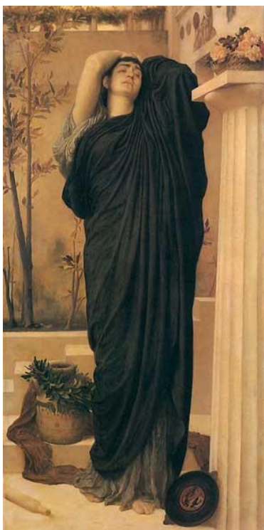
Рис. 5 Лейтон Фредерик. Электра у могилы Агамемнона. Ок. 1869 г. Галерея искусств Ferens'a, Великобритания