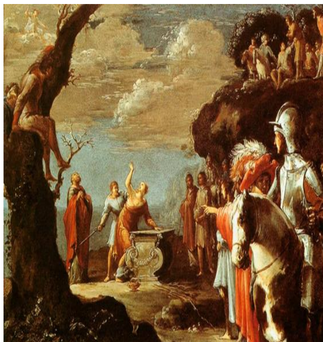
Рис. 8 Брамер Леонард. Жертвоприношение Ифигении, 1623. Принсенхоф, Делфт

Так как старшая из его дочерей – Электра не отличалась особой красотой, то он выбрал свою другую дочь, Ифигению. Однако Агамемнон знал, что его жена никогда не позволит добровольно принести в жертву свою любимую дочь, поэтому отправил жене ложное сообщение, что хочет выдать Ифигению замуж за славного героя Ахилла и должна быть послана на побережье для свадебного обряда. Клитемнестра послушалась мужа и отправила к нему дочь. Когда Ифигения прибыла в его береговой стан, Агамемнон повёл ее в храм Артемиды и оставил там для жертвоприношения (рис. 8) [4].