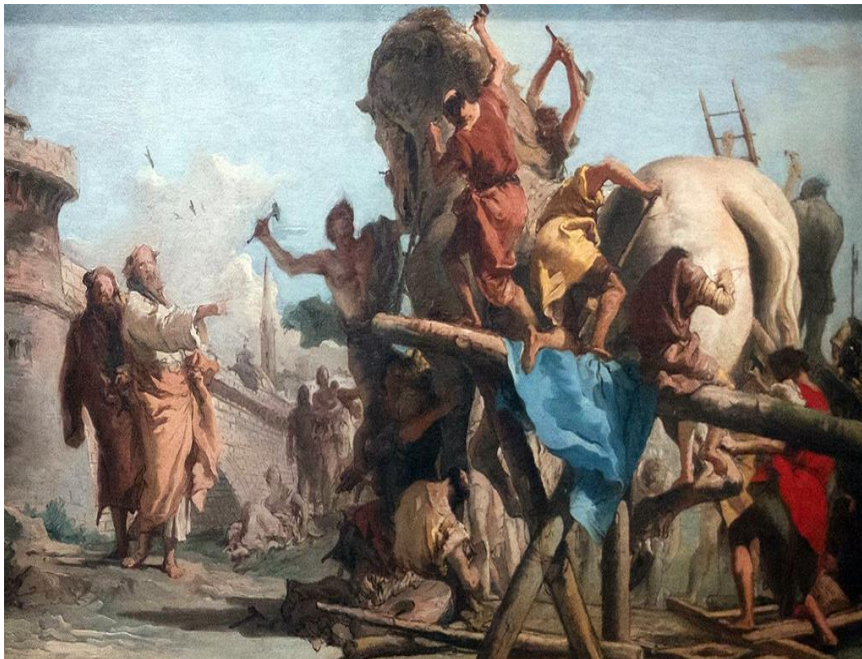
Рис. 3 Джованни Доменико Тьеполо. Строительство Троянского коня.

Другой гомеровский сюжет, распространенный в искусстве, связан с троянским конем.