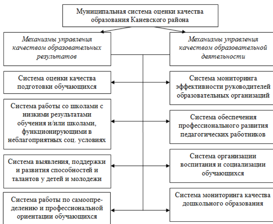
Рис. 2. Механизмы оценки качества образования в Каневском районе

Из рисунка 2 видно, что механизмы управления качеством образовательных результатов состоят из системы оценки качества подготовки обучающихся. В рамках данного модуля в Каневском районе разработана модель муниципальной системы оценки качества подготовки обучающихся, обеспечивающая оптимальное по срокам, содержанию и результатам «встраивание» МСОКО в единое оценочное пространство, что позволяет принимать эффективные управленческие решения на муниципальном уровне. Кроме этого, модель обеспечивает совершенствование внутренних систем оценки качества образования в подведомственных образовательных организациях, что создает единую, многоуровневую управленческую вертикаль качеством образования.