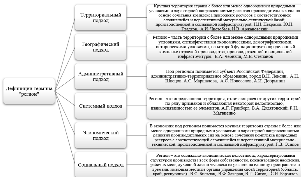
Рис. 1. Различные подходы к дефиниции термина «регион».

В рамках научных интересов исследования, на основании многообразия подходов к определению понятия «регион», выделим наиболее часто рассматриваемые (рис. 1).