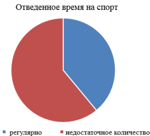
Рис. 1. Время, отведенное на занятия спортом

Результат опроса показывает, что большинство недостаточное количество уделяют занятиям спорту.