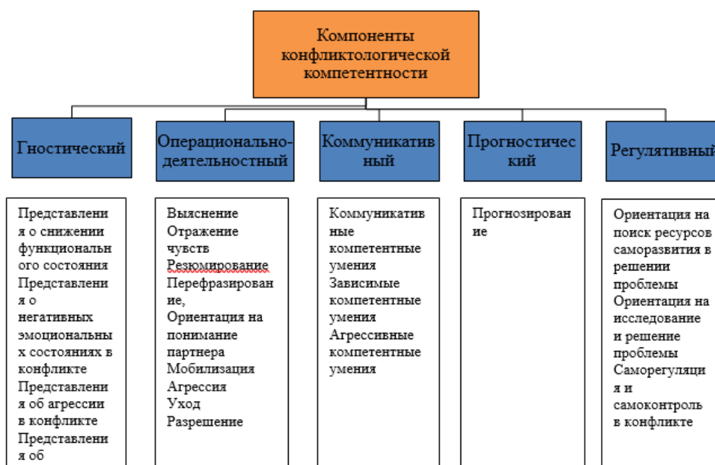
Рис. 1. Компоненты конфликтологической компетентности

Структура конфликтологической компетентности, представленная на рисунке №1 легла в основу данного эмпирического исследования для выявления взаимосвязей между показателями, входящими в различные компоненты конфликтологической компетентности: гностического, операционально-деятельностного, коммуникативного, прогностического и регулятивного и определения их ключевых показателей.